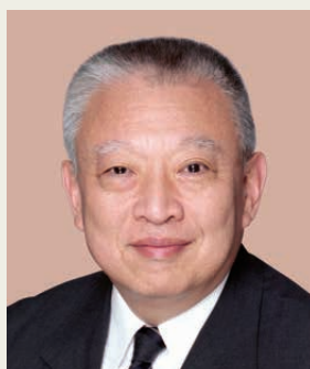
董建華先生 , 大紫荊勳賢 中國人民政治協商會議 第12屆全國委員會（全國政協） 副主席