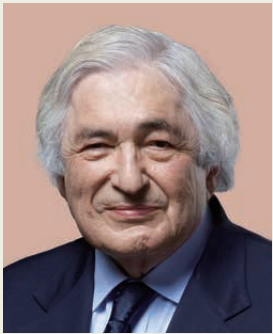
詹姆斯·沃爾芬森博士 Wolfensohn & Company, LLC 主席