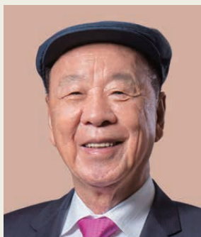
呂志和博士 , 大紫荊勳賢, MBE, JP 「呂志和獎」 創辦人及董事會主席暨 獎項理事會主席