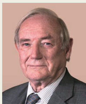
科林·盧卡斯爵士教授 , BBS 牛津大學 榮休校長