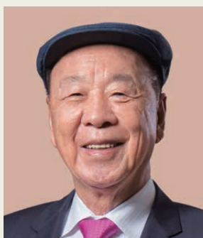
呂志和博士 , 大紫荊勳賢, MBE, JP 「呂志和獎」創辦人及董事會主席暨 獎項理事會主席