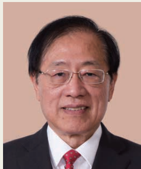
姚期智教授 清華大學 交叉信息研究院院長