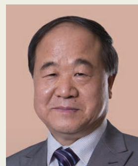
莫言博士 2012年諾貝爾文學獎得獎者