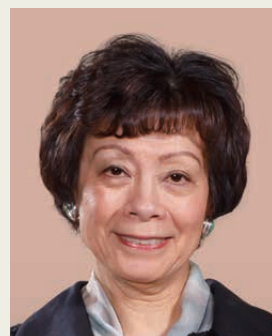
葉文心教授 伯克萊加州大學 校長高級中國顧問