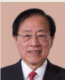
姚期智教授 清華大學 交叉信息研究院院長