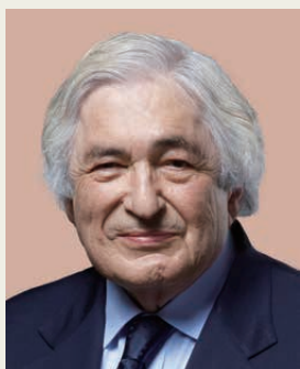
詹姆斯·沃爾芬森博士 Wolfensohn & Company, LLC 主席