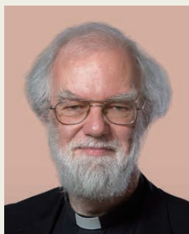
羅雲·道格拉斯·威廉斯博士 劍橋大學 默德林學院院長