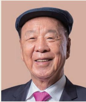
呂志和博士 , GBM, MBE, JP 呂志和獎創辦人及董事會主席暨 獎項理事會主席