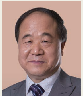
莫言博士 2012年諾貝爾文學獎得獎者