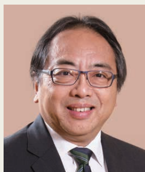
徐立之教授, OC, PhD, FRS, FRSC, GBM, GBS, JP 經綸慈善基金 理事長