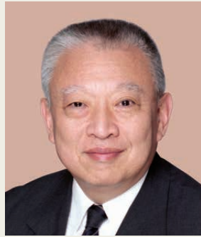
董建華先生 , 大紫荊勳賢 中國人民政治協商會議 第12屆全國委員會（全國政協） 副主席